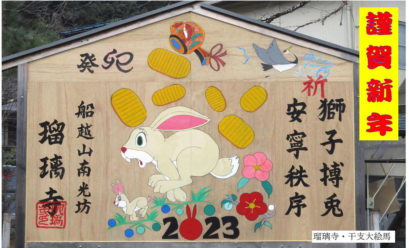
瑠璃寺・干支大絵馬

ホームページアドレス http://sayosilver.sakura.ne.jp