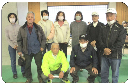
三日月月地域参加者